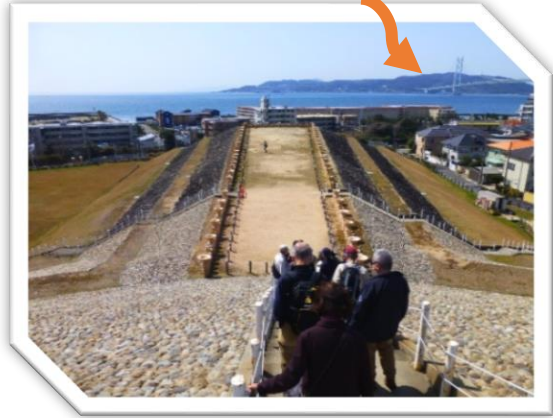
五色塚古墳（神戸市垂水区）