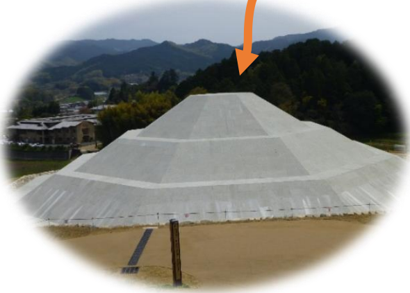
齊明天皇陵（明日香村）