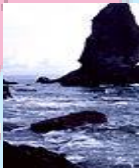
国生み神話ゆかりの沼島